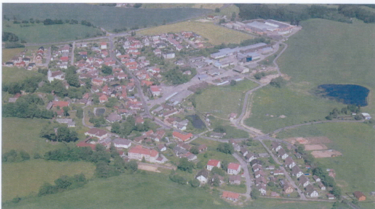
Obr. 1 – letecký pohled na obec Dušejov

Obec Dušejov se nachází v okrese Jihlava, kraj Vysočina. Nachází se 14 km od krajského města Jihlava a 18 km od města Pelhřimov. Od dálnice D1 jí dělí vzdálenost 15 km. Katastr obce o velikosti 4,87 km 2 je velmi členitý. Obec se nachází v nadmořské výšce 610 m.