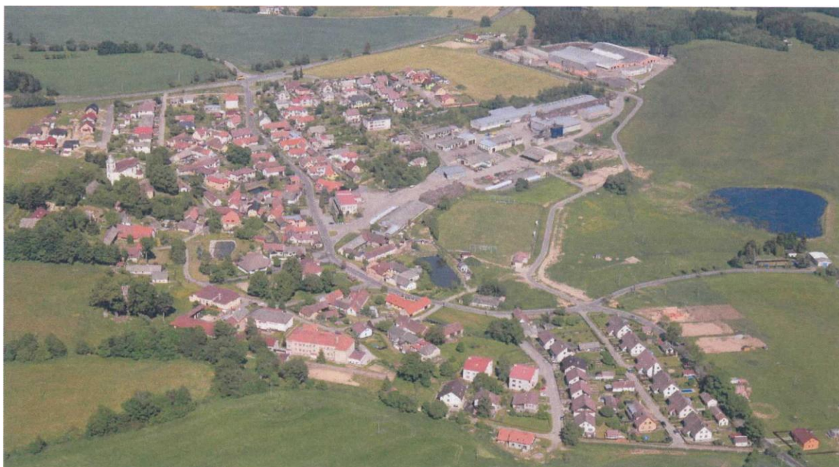
Obr. 1 – letecký pohled na obec Dušejov

Obec Dušejov se nachází v okrese Jihlava, kraj Vysočina. Nachází se 14 km od krajského města Jihlava a 18 km od města Pelhřimov. Od dálnice D1 jí dělí vzdálenost 15 km. Katastr obce o velikosti 4,87 km 2 je velmi členitý. Obec se nachází v nadmořské výšce 610 m.